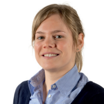
An Tiersens Tax Counsel